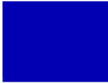
PANTONE REFLEX BLUE

Niebieski Pantone reflex - powierzchnia prostokąta