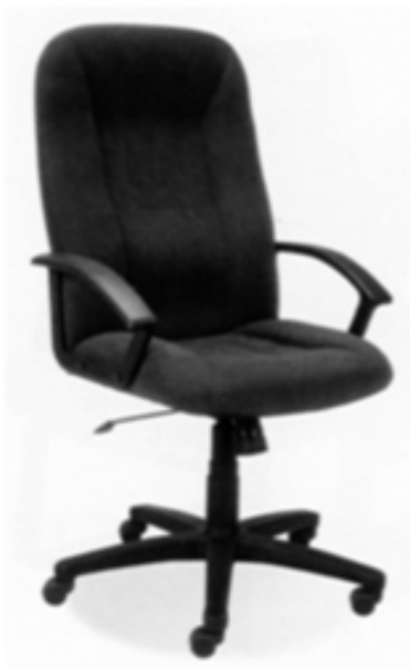
Poz.3 i 4