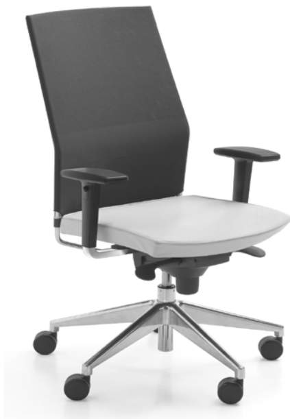
Rys. 2 Przykładowy wygląd fotela