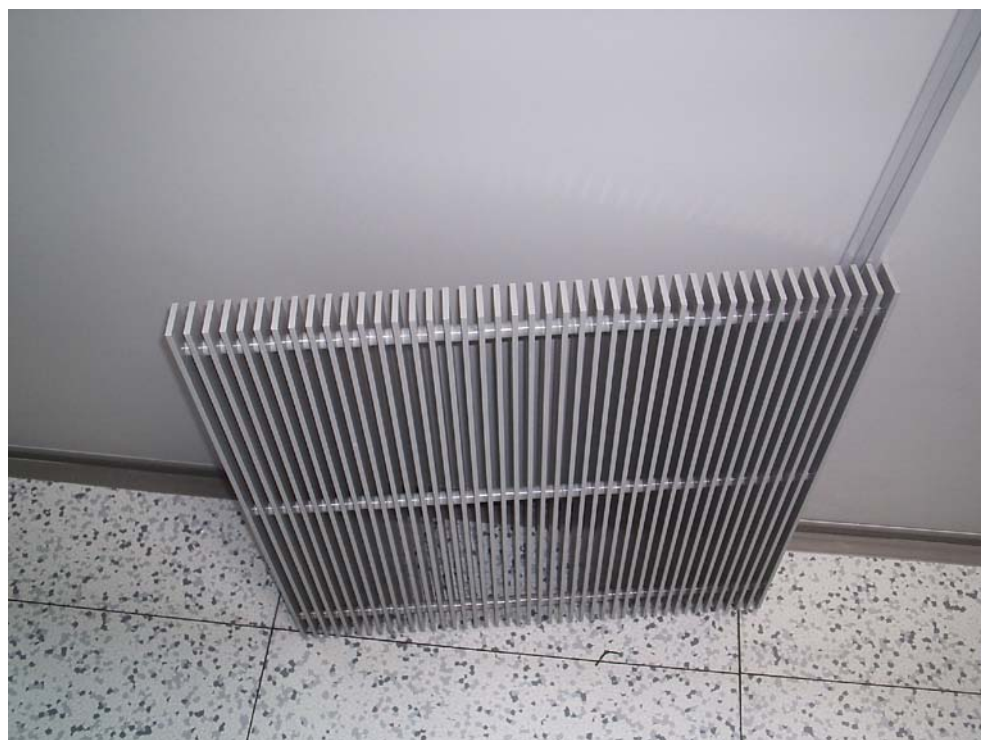
Rys. 3 Zdjęcia kratki nawiewowej typu KWP-600