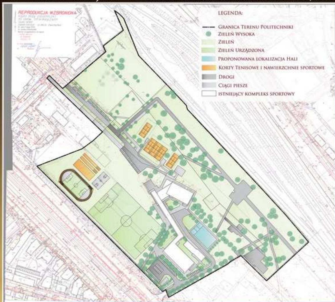
MAPA KONTEKSTOWA ZAGOSPODAROWANIA TERENU DLA III WARIANTU USYTUOWANIA

AUTORZY: MGR INŻ. ARCH. NATALIA KUŁAK-MALIŃSKA , MGR INŻ. ARCH. JACEK POBŁOCKI