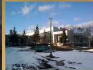
WIZUALIZACJA "DZIEDZIŃCA" WENĘTRZNEGO KOMPLEKSU