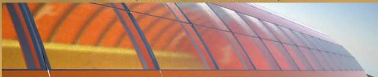
DETAL ŚWIETLIKÓW DOŚWIETLAJCYCH