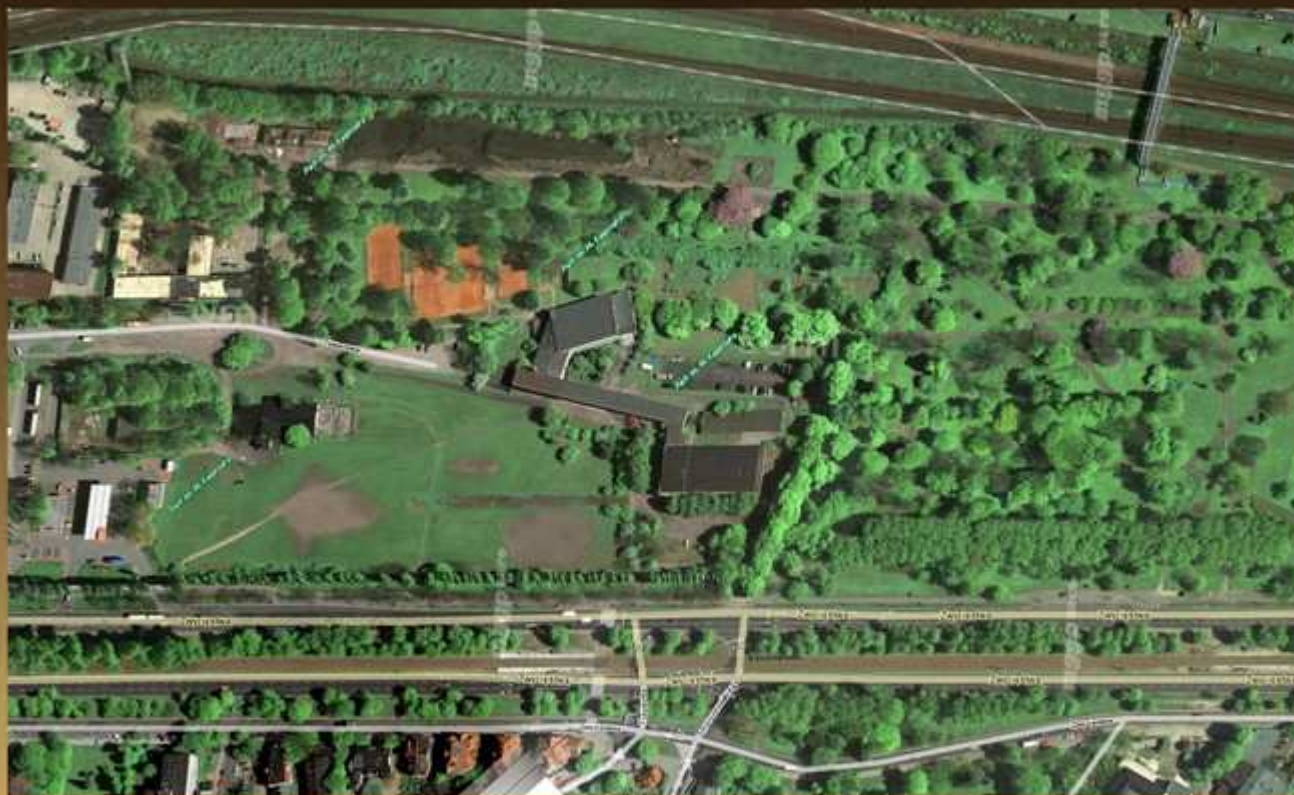
WIDOK AOS-U PG Z LOTU PTAKA

AUTORZY: MGR. INŻ. ARCH. NATALIA KULAK-MALIŃSKA , MGR. INŻ. ARCH. JACEK POBŁOCKI