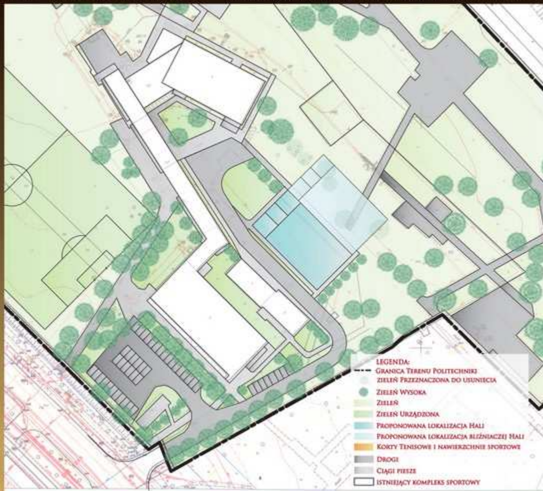
MAPA ZAGOSPODAROWANIA TERENU DLA II WARIANTU USYTUOWANIA HALI OPCJONALNA DOBUDOWA BLIŹNIACZEJ HALI Z ZAZNACZONĄ ZIELENIĄ DO USUNIĘCIA

AUTORZY: MGR. INŻ. ARCH. NATALIA KUŁAK-MALIŃSKA, MGR. INŻ. ARCH. JACEK POBŁOCKI