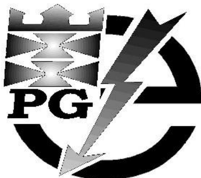
Rys. 2 Projekt graficzny logo kubka. Wymiary nadruku 75mm x 170mm

Wydział Elektrotechniki i Automatyki Politechniki Gdańskiej