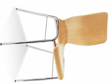
F3 KRZESŁO - 31 szt. kolor: sklejka jasny buk naturalny